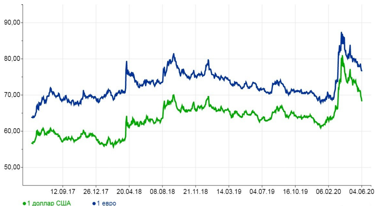
Рисунок 3 – Динамика валютного курса за 2017-2020 год (составлен на основе [12])

Данная динамика представлена на рисунке 3.