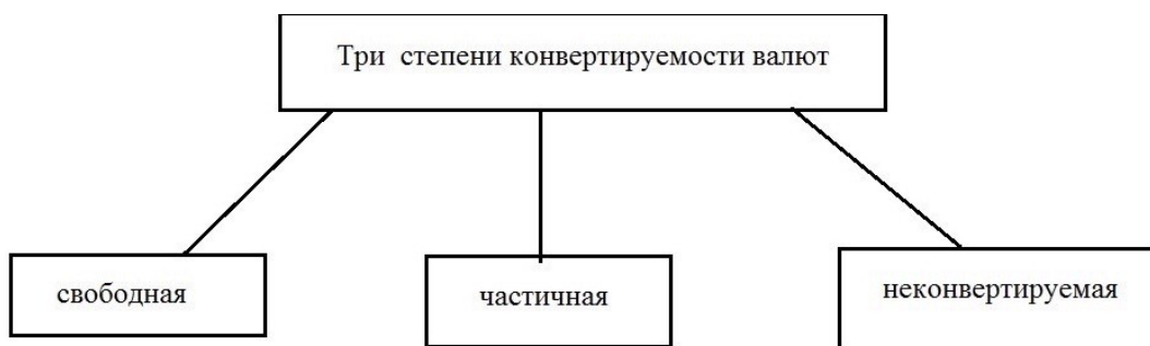
Рисунок 2 – Три степени конвертируемости валют (составлен автором на основе [15])

Степени конвертируемости валюты представлены на рисунке 2.